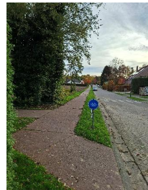
Hermelijnstraat en Perkstraat: extra bomen langs akkers