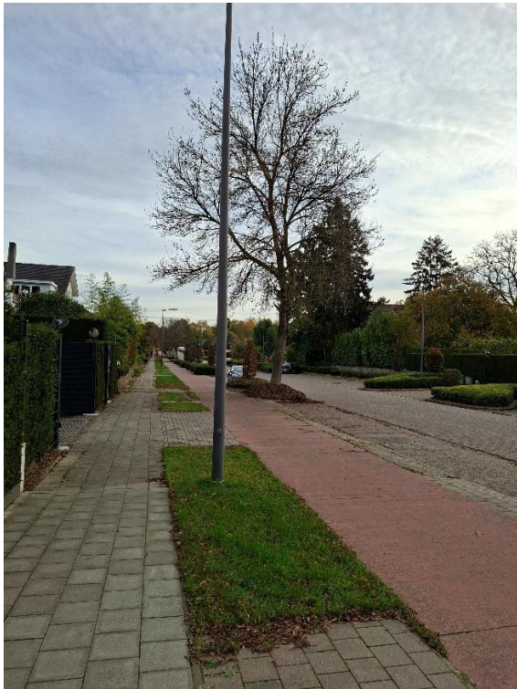
Hippodroomlaan tss Mechelsesteenweg en Perkstraat