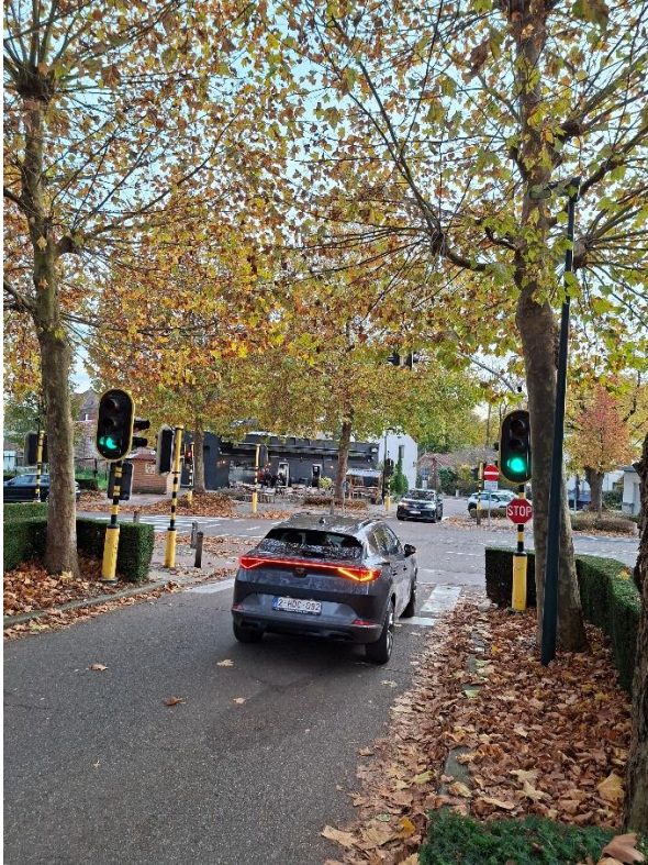
Kruispunt onderaan Windmolenlaan blijft onveilig voor overstekende fietsers