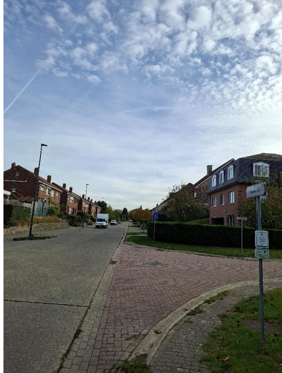
Waalsestraat richting veldweg, opbreken stukken één rijstrook voor waterinsijpeling en boom