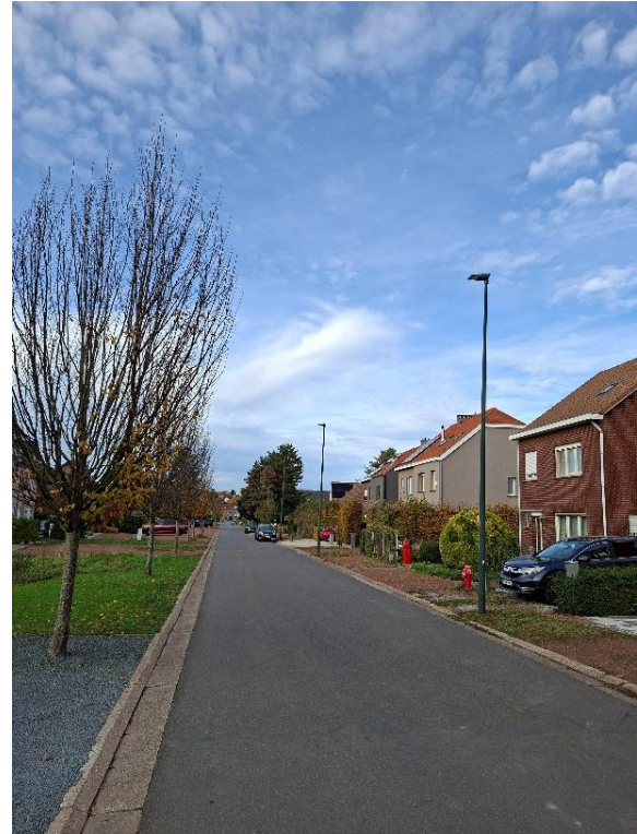
Fietspad: Moorselsesteenweg naar Moorsel Vossemlaan tss Moorselstwg en Bosdelle (F203)