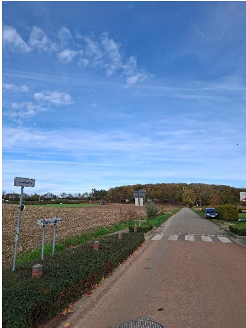
Bosdellestraat langs akkers Voskapel