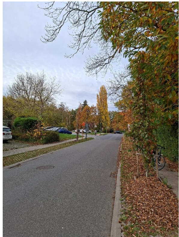
Geen markering voor fietsers die bovenaan Windmolenlaan oversteken naar fietspad