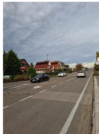
Leuvensesteenweg blijft zonder fietspaden levensgevaarlijk voor fietsers/steppers