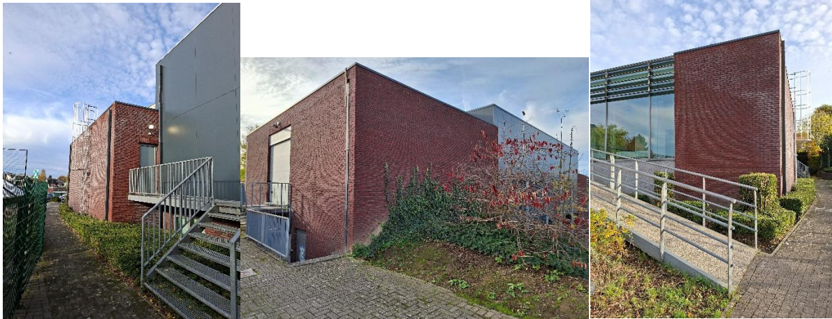
Geveltuinen Maalderij en Gemeenteschool