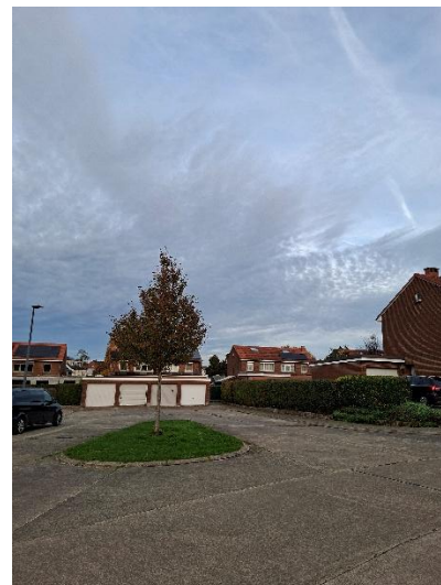
Groene plekjes meer beplanten: grasvelden Pancratiuswijk