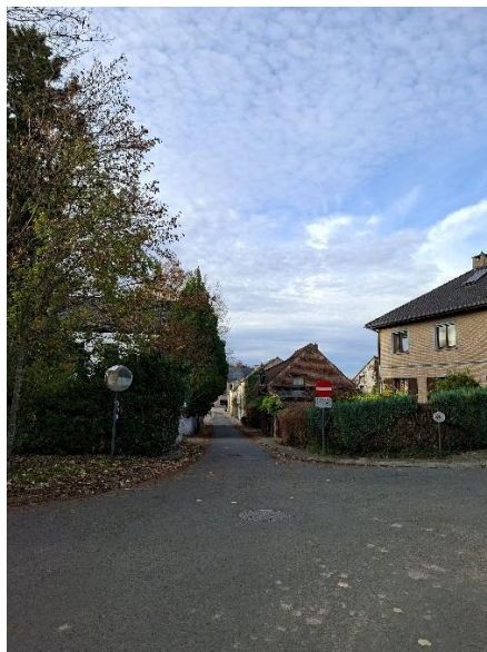
Frans Peetersstraat: opbreken stukken van één rijstrook om insijpelen water te bevorderen in combinatie met planten van bomen