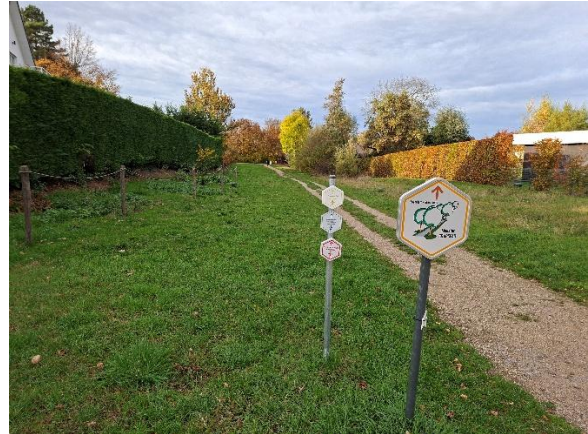
Plein Panoramalaan en grasveld aan het doorsteekpad naar het Zeenpark